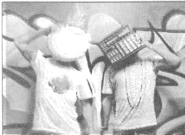
Une soirée musicale haut en couleur au rendez-vous.

La soirée débutera à 17h au café Baudelaire pour un